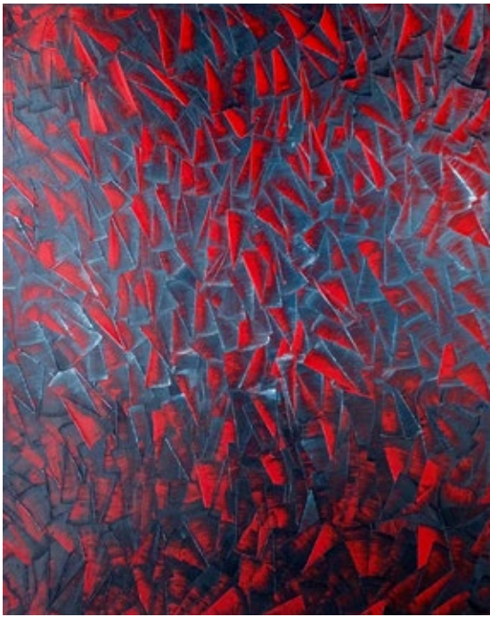
Carole Jury VISUEL1 FLYING KITE1 40,6x50,8cm