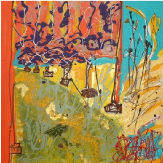
Isa Sator Une orange à central park Hommage à Cristo Acrylique sur toile 60x60cm