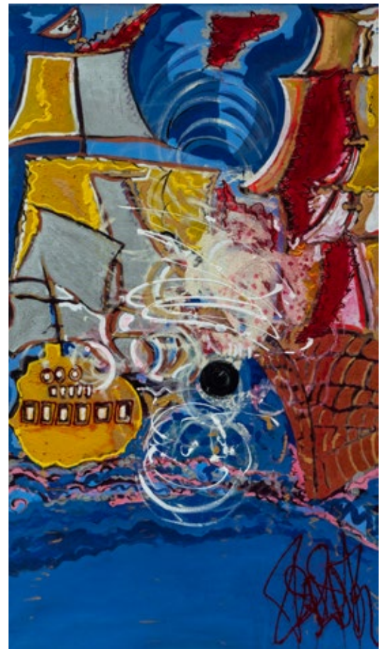
Isa Sator A boulet tiré Acrylique sur toile 190x115cm