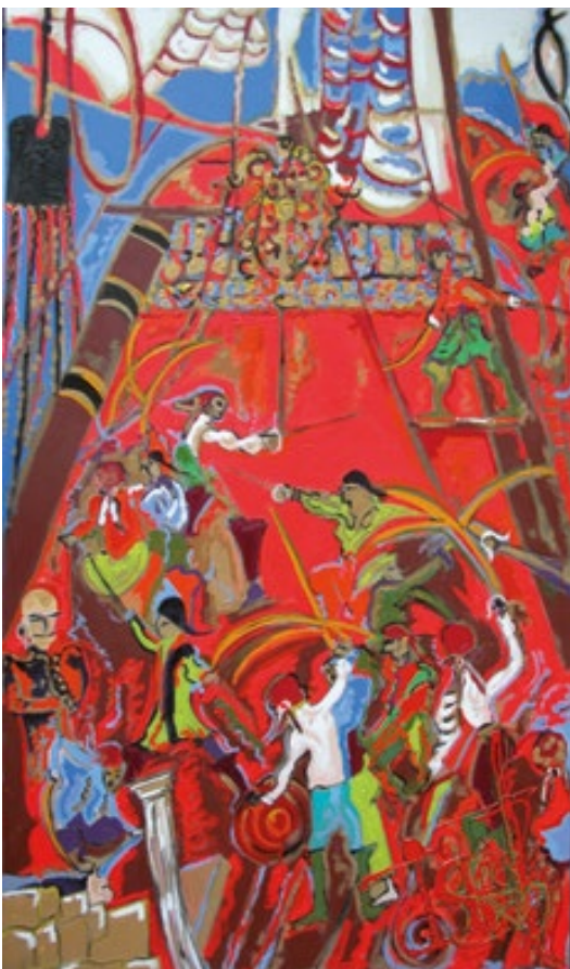
Isa Sator Action Acrylique sur toile 190x115cm