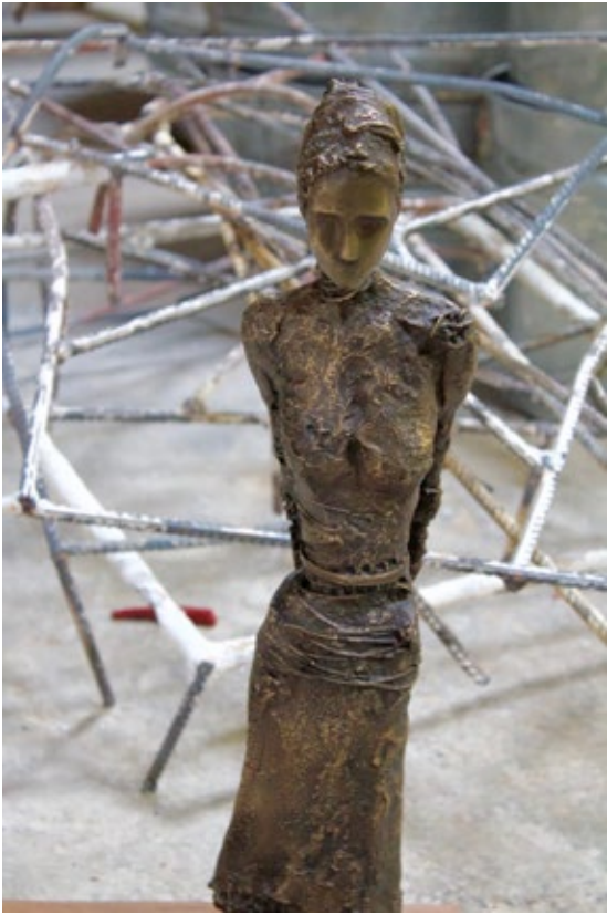
Anne de Villeméjane Walking Woman Bust Bronze 20.5 x 5 x 5 inches