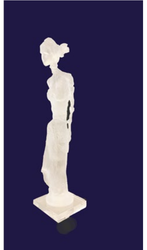
Anne de Villeméjane Walking woman bust Acrylic 26x5.5x4 inches