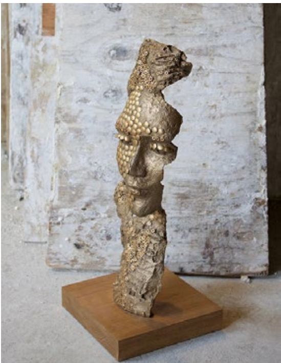
Anne de Villeméjane Tattoo Bronze 23 x 11 x 12 inches